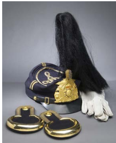
Mössa 1865 med plåt, pompong och plym , epåletter och handskar för fanjunkare