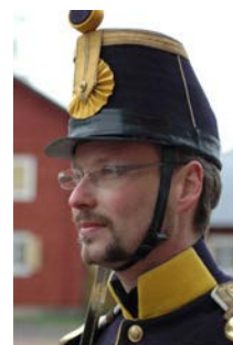
Käppi modell 1858

Uniformen vi låtit tillverka är en svensk infanteriuniform modell 1860/72. Förebilden kom från den franska jägaruniformen från samma tid. Vapenrocken var mörkblå och byxan grå-blåmelerad på vintern och vit på sommaren. 1872 ändrades färgen på byxan till samma blå som vapenrocken. Till uniformen hörde en huvudbonad, Käppi modell 1858. Den är tung, hård och hög, vilket kan förklara att en ny huvudbonad kom redan efter 7 år. Mössan vi använder är infanteriets modell 1865, som inspirerats från amerikansk modell. Till uniformen hörde sabel och vita eller gula handskar även till vardags för officerare och underofficerare. Korpraler och manskap hade faskinkniv eller huggare. Vid högtidliga tillfällen användes paradplåt i mössan och paradeskärp runt livet, s.k. liten parad. Vid stor parad försågs mössan även med pompong och plym.