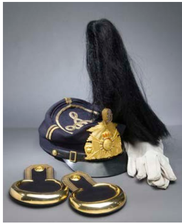
Mössor 1865 med plåt, pompong och plym, epåletter och handskar för fanjunkare